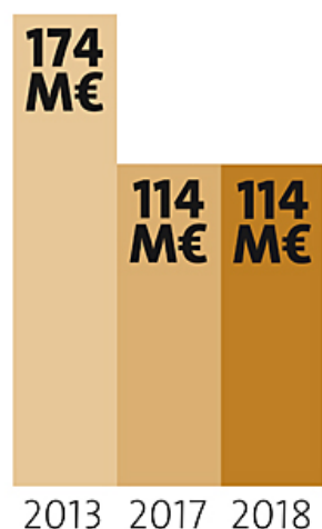
Dotations globales de fonctionnement versées par l'État