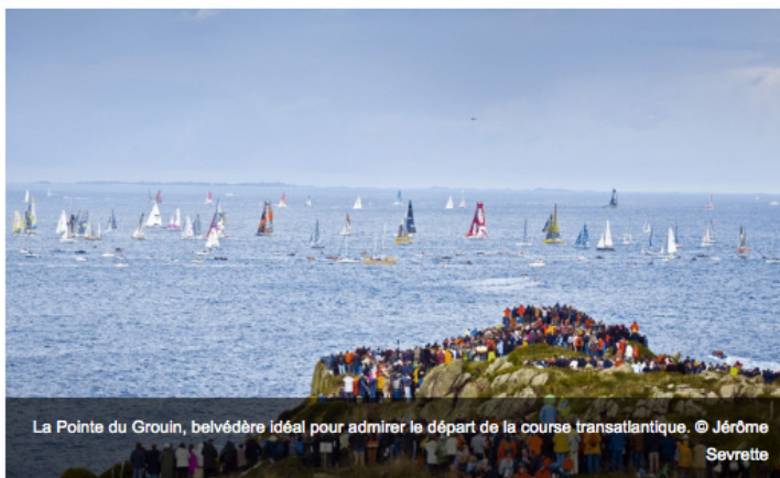
La Pointe du Grouin, belvédère idéal pour admirer le départ de la course transatlantique.

Dimanche 2 novembre, une soixantaine de Bretilliens ont profité d'un accès VIP au sémaphore de la pointe du Grouin, entre Cancale et Saint-Malo. Tous étaient conviés par les professionnels de l'action sociale du Département à assister au départ de la transatlantique en solitaire.