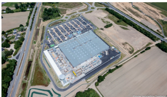
Vue aérienne du magasin Leroy Merlin en juin 2014.