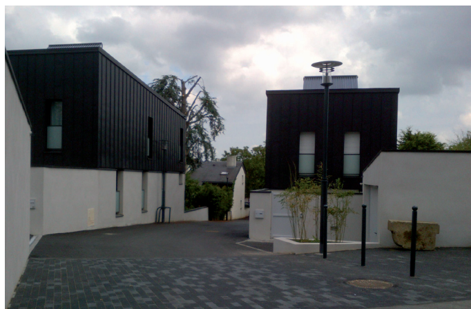
Programme JV3 dans le quartier de la Courrouze à Rennes.

En avril 2014, le dernier programme JV3 (3 logements en accession labellisés basse consommation) a été livré.