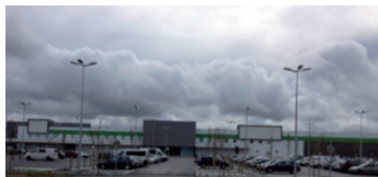
Vues du parking du magasin Leroy Merlin.

Le 4 juin 2014, l'acte de vente a été signé au profit d'ITM ( Intermarché ). Les travaux ont démarré le 30 juin 2014. Le projet se compose d'un hypermarché d'une surface de vente de 4 999 m 2 , d'une galerie marchande d'une surface de vente de 3 967 m 2 , d'un centre auto de 300 m 2 et d'un centre de contrôle technique.