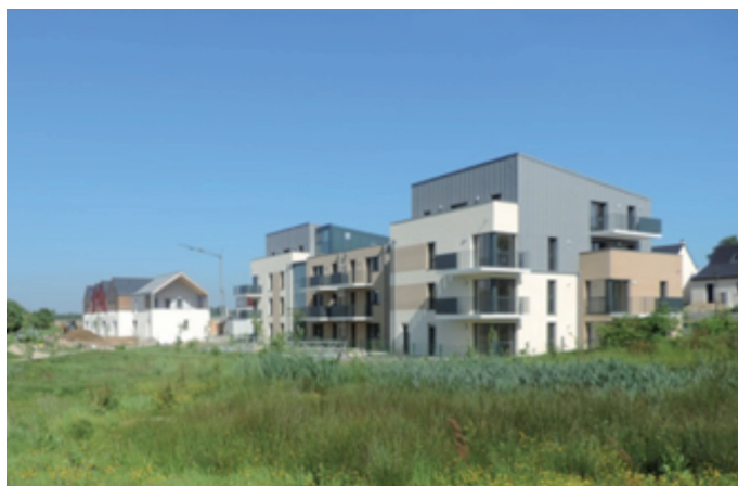
Vue des deux programmes livrés au printemps 2014.

La tranche 2 A de l'opération est également entrée en phase opérationnelle puisque les travaux ont démarré en février 2014. Cette seconde tranche sera réalisée en deux temps (pour tenir compte du rythme de commercialisation) et comportera à terme 180 logements. La commercialisation a débuté en décembre 2013 et déjà plus de 40 % des terrains en vente sont réservés à ce jour .