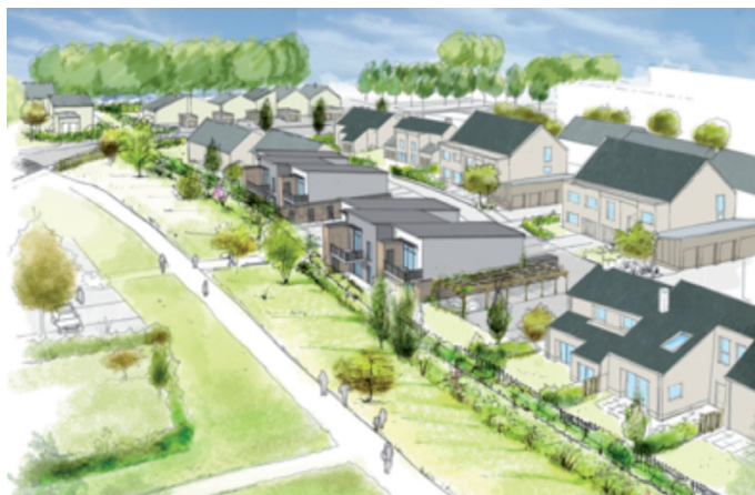
Esquisse : Atelier du Canal.

Par ailleurs, un compromis de vente a été signé courant 2013 avec le promoteur CHESSE afin de réaliser un ensemble immobilier commercial composé d'une douzaine de cellules commerciales destinées principalement à l'équipement de la personne et de la maison pour une surface de plancher d'environ 6 500 m 2 . L'autorisation commerciale (CDAC) a été obtenue et le permis de construire est en cours de préparation.