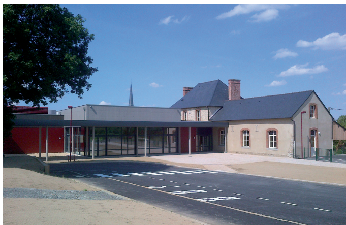
Nouvel équipement communal.

L'ouverture au public des locaux est prévue le 07 juillet 2014.