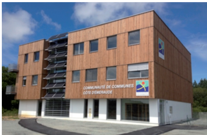
Nouvel hôtel de la Communauté de Communes de la Côte d'Émeraude Architecte : Axiale Architecture.

Sobre et élégant, performant et économe, respectueux et durable sont les qualificatifs qui définissent le mieux ce bâtiment d'une nouvelle génération.