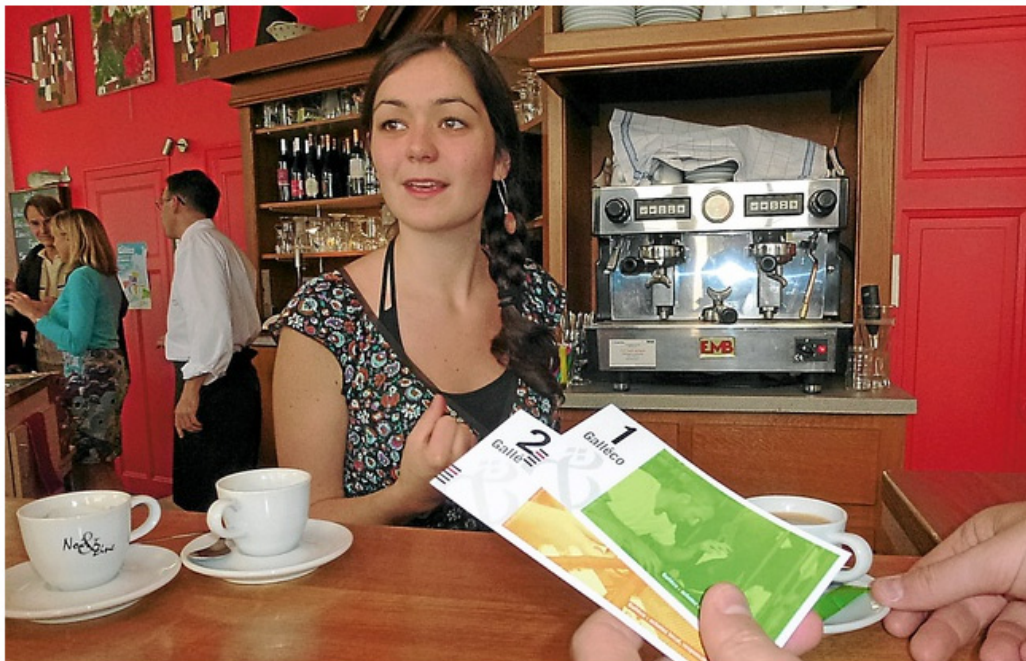
A Rennes, le Café Cortina fait partie des endroits qui acceptent le galléco.

Je lis ce jour ceci sur le site du quotidien 20Minutes :