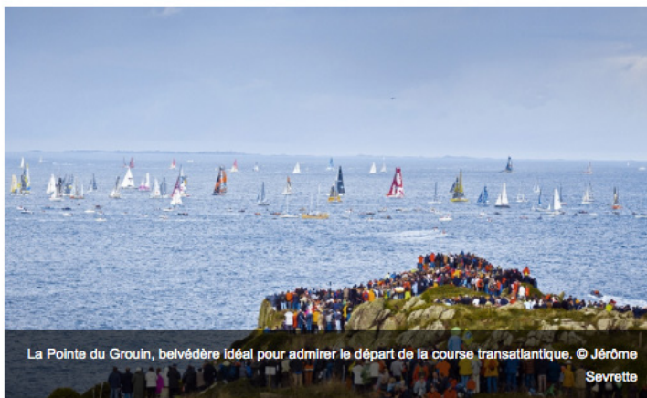
La Pointe du Grouin, belvédère idéal pour admirer le départ de la course transatlantique.

Dimanche 2 novembre, une soixantaine de Bretilliens ont profité d'un accès VIP au sémaphore de la pointe du Grouin, entre Cancale et Saint-Malo. Tous étaient conviés par les professionnels de l'action sociale du Département à assister au départ de la transatlantique en solitaire.